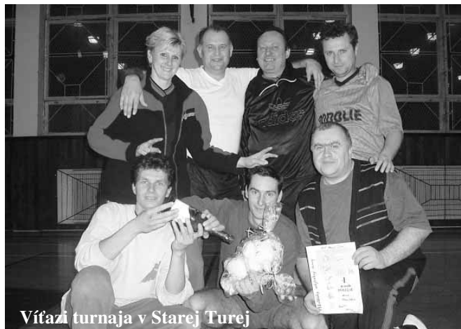
Vítazi turnaja v Starej Turej

Už veľa rokov sa každý týždeň stretávajú skupina volejbalistov v telocvični ZŠsMŠ v Podolí, aby si zahráli volejbal, ale sa aj pripravili na zápasy, ktoré pravidelne organizujú okolité základné školy: I. ZŠ Nové Mesto nad Váhom, Cirkevná škola sv. Jozefa Nové Mesto nad Váhom, ZŠ Stará Turá, ZŠ Horná Streda, ZŠ Bzince pod Javorinou a tiež ZŠ Podolie. Tento rok bol pre nich rokom úspešným. Dobre reprezentovali našu ZŠ ale aj obec, keď sa im podarilo získať 1. miesto na turnajoch v Novom Meste nad Váhom, Starej Turej, Hornej Strede a v Podolí. Prajeme im idobudúcich turnajov veľa zdravia a dobrých športových výkonov. PC