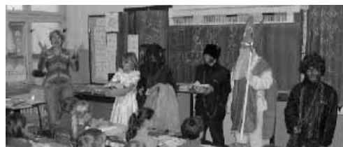
Mikuláš chodil aj na našej škole spolu s anjelom a štyrmi čertami, 6.12.2005