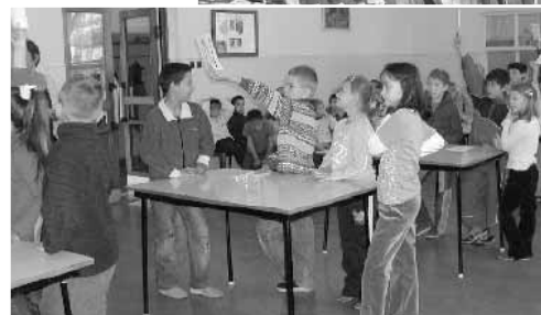
Deti 1.stupňa súťažili na Deň jablka, 27.10.2005