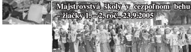
Majstrovstvá školy v cezpoľnom behu – žiačky 1. – 2. roč., 23.9.2005